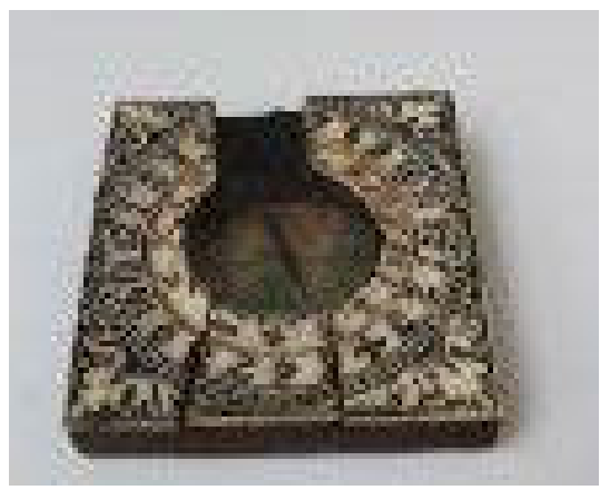
La mostra traccera' le geografie consociute, attarverso la cartografia italiana e cinese del XV secolo, strumenti di navigazione e di viaggio usati a partire dal tempo di Marco Polo.